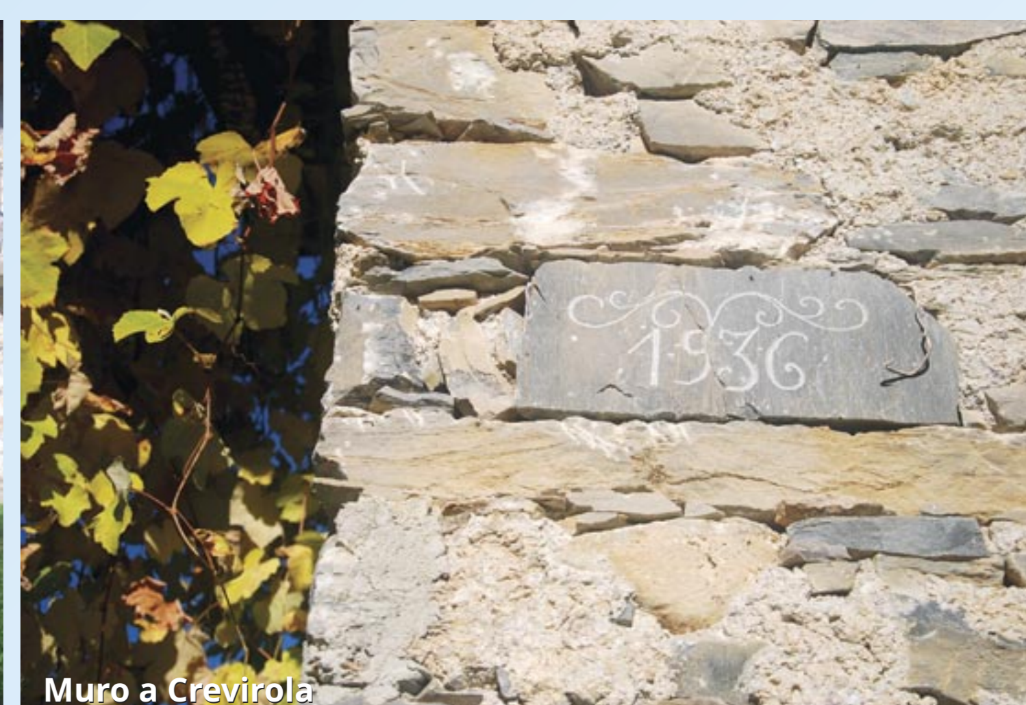
Muro a Crevirola