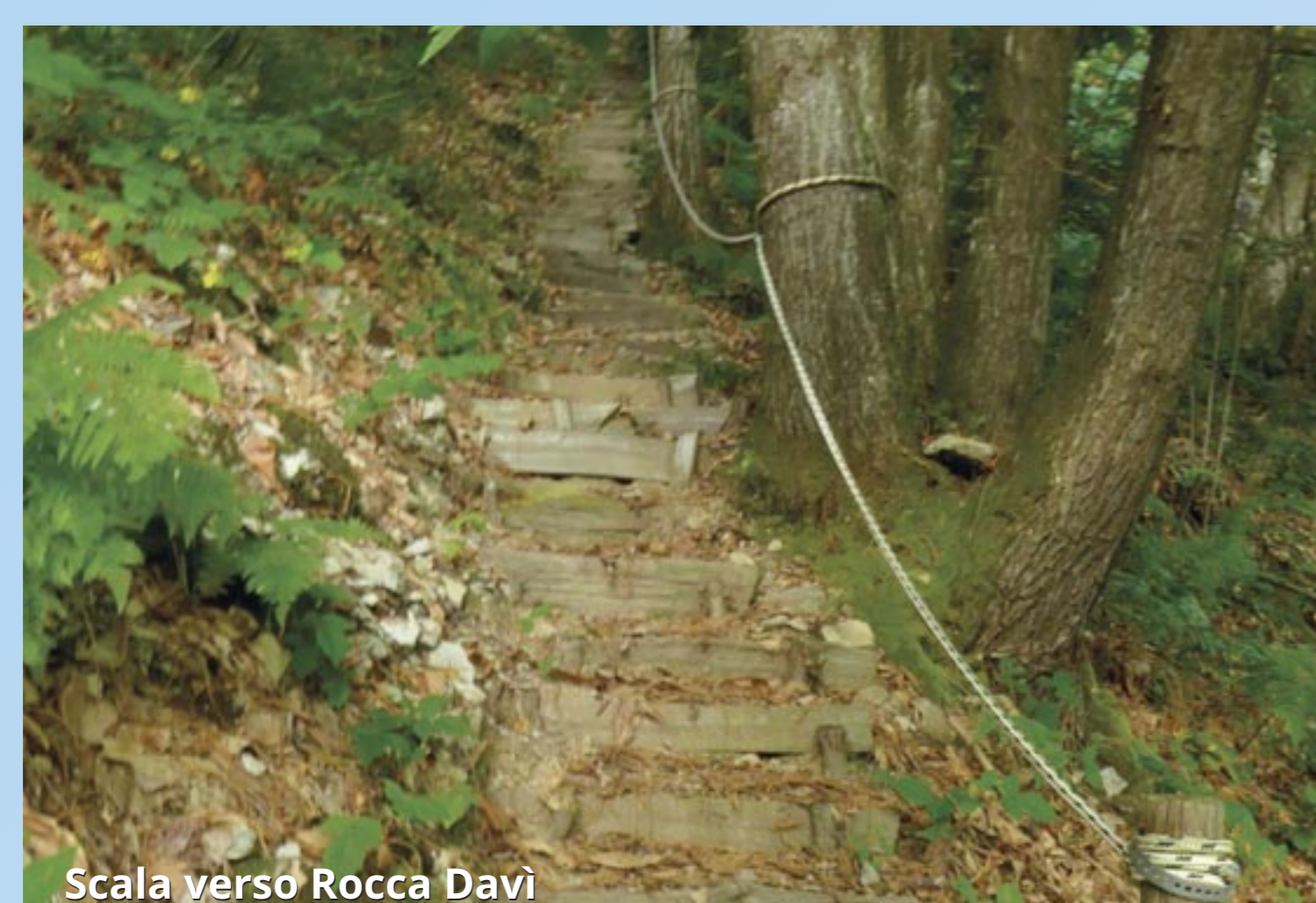
Scala verso Rocca Davi